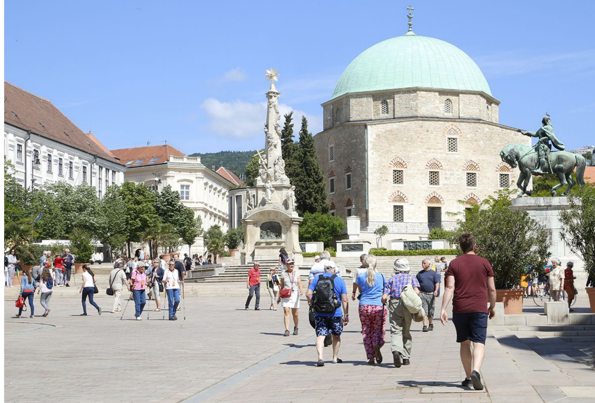
Nincs kit vezetnie az idegenvezetőknél