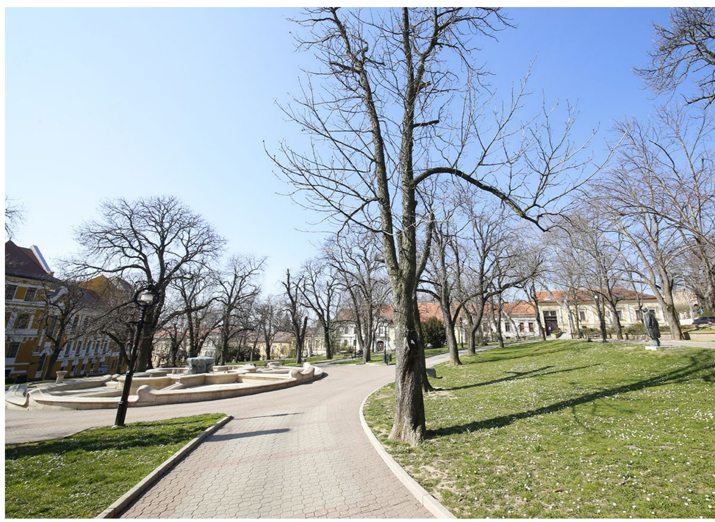
Se pécsiek, se turisták

– Sok idegenvezető kolléga másodállásként kíséri a csoportokat, bízunk benne, hogy a főállásuk biztos alapokon van és aktívan tudnak tovább dolgozni. Ugyanakkor vagyunk páran, akiknek az idegenvezetés a főállásunk, így bevételünk csak akkor van, ha érkezik csoport. A csoportok elmaradása sajnos nagyon érződik a pénztárcánkon. Családi összefogással és tartalékok felélésével tudjuk ezt a szezont átvészelni.